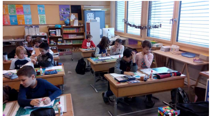
Réponse au questionnaire en duo.