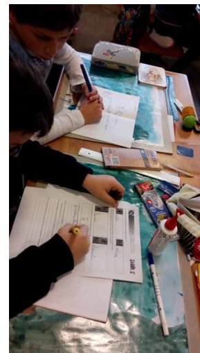
Réponse au questionnaire en duo en s'aidant des notes prises lors du visionnement.