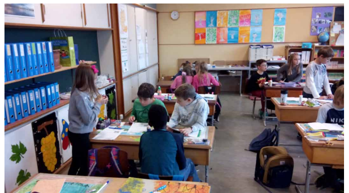
Deux duos se rassemblent pour compléter le questionnaire.