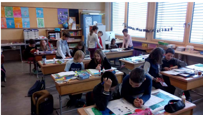
Changement de duo pour compléter le questionnaire.