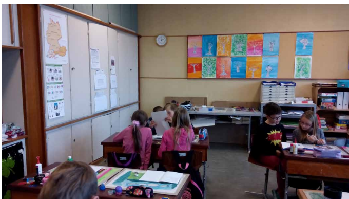
Réponse au questionnaire en duo.